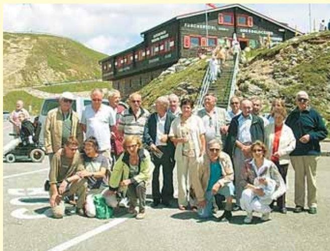
Primorski CIV-i na velikem Kleku.