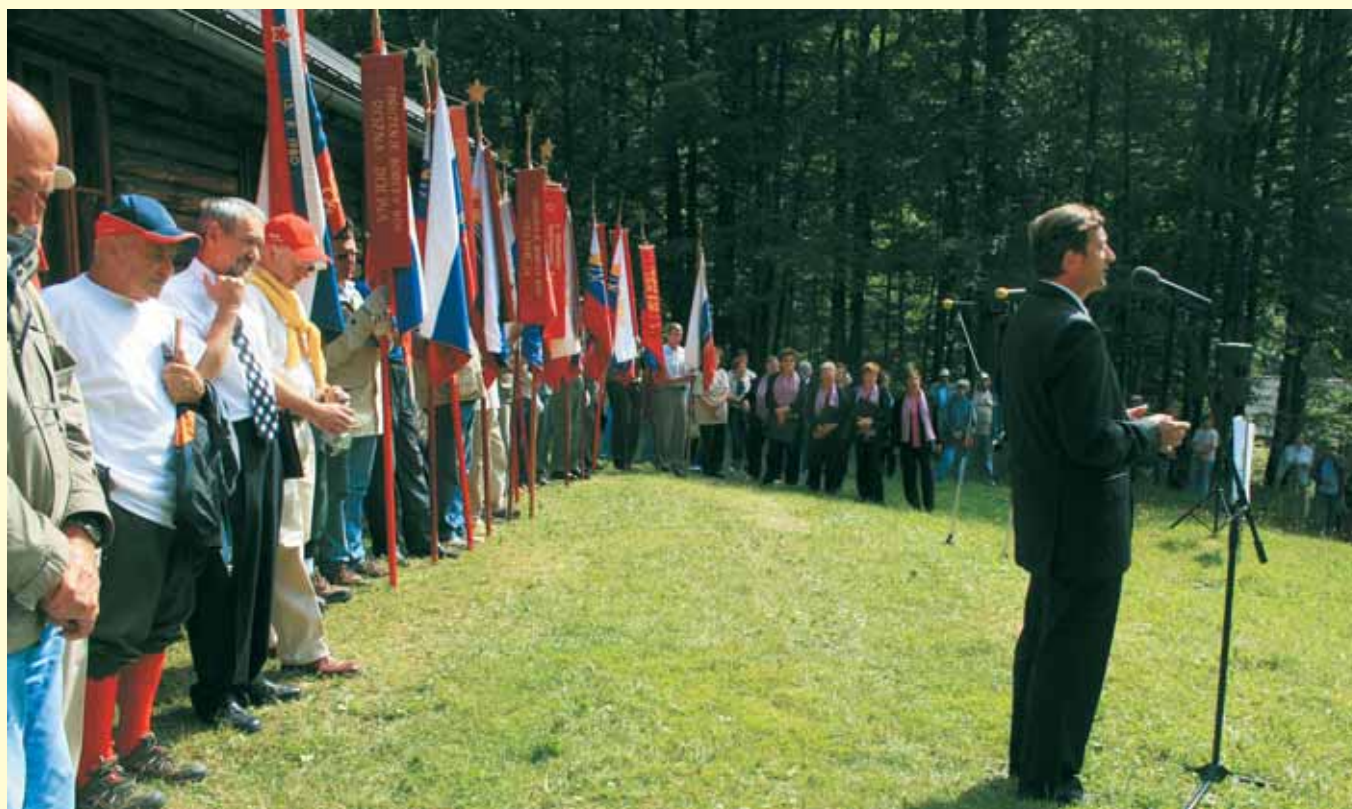
Spomin na dogodke na Hudem polju vsako leto pospremiijo praporščaki.