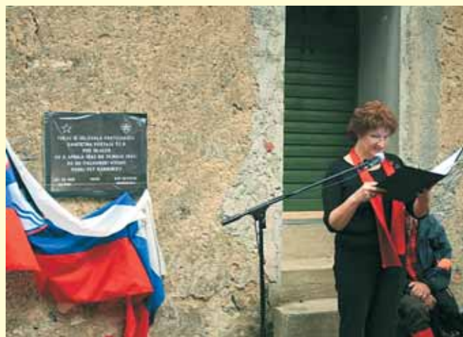
Spominska plošča bo trajen spomin na pet ranjencev, ki so jih pobili italijanski okupatorji.