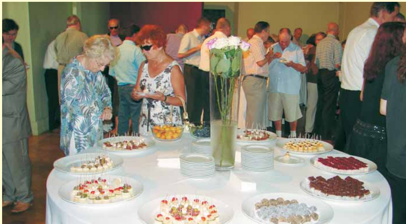
Po slovesnosti ob Dnevu CIV so se udeleženci družili ob prigrizku.

ostalih civilnih invalidov vojn, ki so postali invalidi zaradi vojnih grozot druge svetovne vojne in eksplozij opuščenega vojaškega materiala. Neeksplodirana ubojna sredstva iz druge svetovne vojne je še danes moč najti in tako še