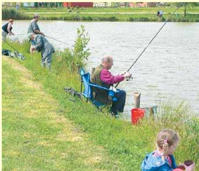
Trnke so v vodo namakali mladi in stari.

Izvajalec je po koncu vsakega tekmovanja napisal poročilo, v katerem je opisal potek tekmovanj in podal svoje pripombe. Poročila so podlaga za ugotavljanje uspešnosti izvedenega programa in usmeritve za naše nadaljnje delo. Na vseh tekmovanjih je bil prisoten tudi delegat zveze, ki je skrbel za pravilnost tekmo-