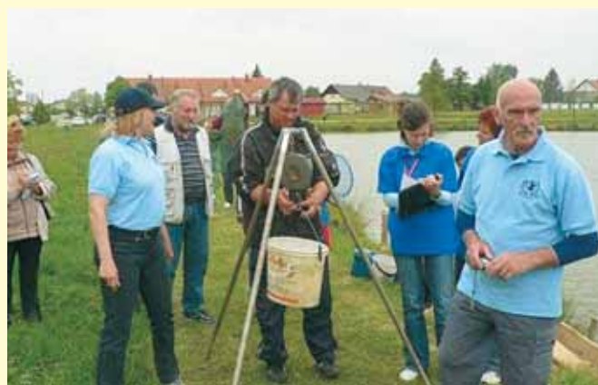
Tehtanje ulova pod budnim očesom tekmovalcev.

vanja in opravljal naloge po 20. členu pravilnika. Vsa tekmovanja so potekala po Pravilniku o organizaciji in izvedbi športno rekreativnih prireditev ZDVIS.