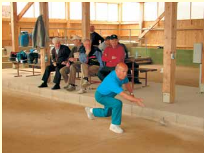
Pri balinanju je pomembna natančnost.