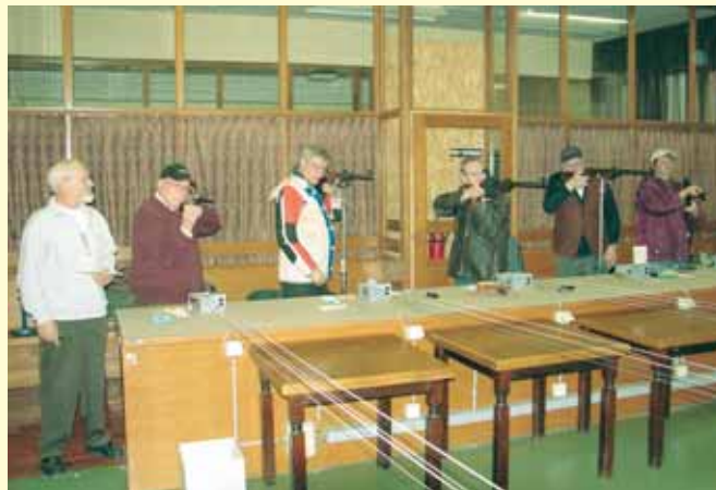
Za natančen strel v tarčo je potrebna mirna roka in obilo koncentracije.