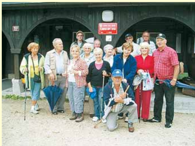
Civilni invalidi vojn v dolini Tamarja.