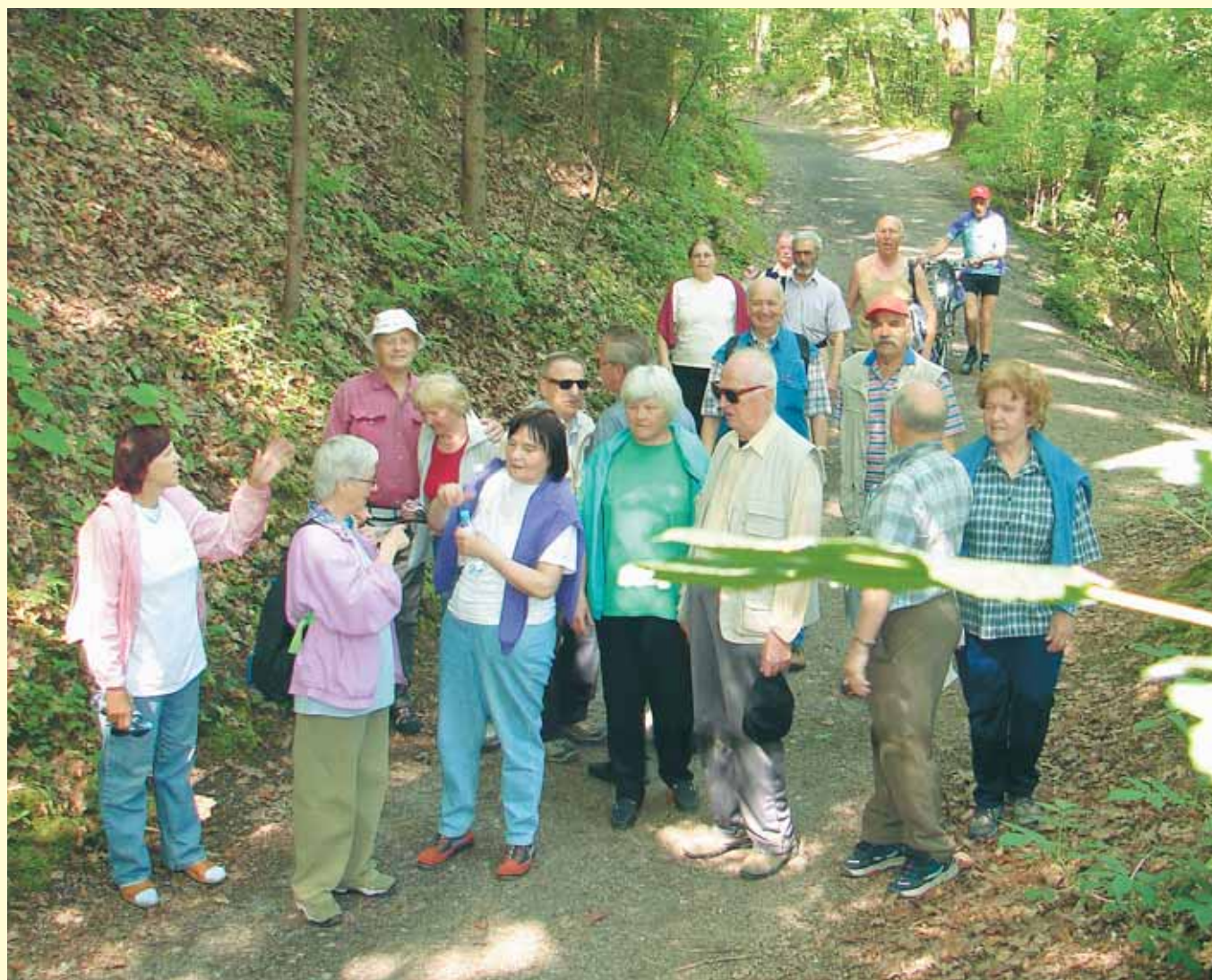
Tudi pohodništvo je gibanje in šport. CIV-i na pohodu ob žici.