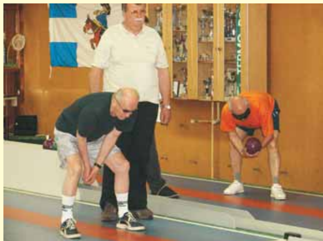
Pred tekmovanjem se ne sme pozabiti na ogrevanje.