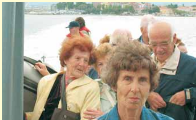
Primorci na vojaški ladji Ankaran.

D ruštvo vojnih invalidov Slovenske Istre je tudi v poletnem tromesečju delovalo po načrtanem programu dela. V tem času smo rešili tudi veliko socialnih zadev in obiskali več bolnih članov. Tako kot vsako leto smo se udeležili srečanja vojnih invalidov in družinskih članov v Šempetru pri Novi Gorici. Naši člani so bili zelo zadovoljni z organizacijo srečanja, za kar DVI Severne Primorske zasluži vso pohvalo. Z našimi invalidi smo si ob tej priložnosti organizirano ogledali še spomenik na Cerju, vendar z vodičema nismo bili zadovoljni. Veliko se je govorilo o prvi svetovni vojni, ničesar pa o dogodkih iz obdobja NOB. S tem smo seznanili društvo