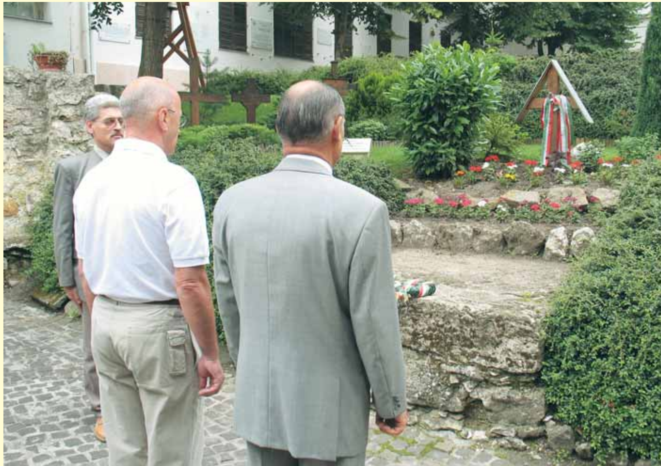
Predstavniki slovenskih in madžarskih vojnih invalidov so se poklonili spominu na neznanega junaka.