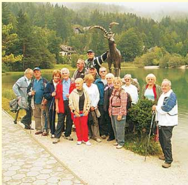
Nekateri civilni invalidi vojn so planinski del naše dežele obiskali prvič.

Udeleženci so bili nad delavnico in vodenim načinom druženja izjemno zadovoljni. Nekateri izmed njih so presenetili sami sebe, saj smo se vsi skupaj podali na pohod v dolino Tamar. Kar nekaj udeležencev je prvič prišlo pod veličastne gore, ki obdajajo Tamar in jim bo ta dosežek za vedno ostal v lepem spominu. Lahko smo ponosni nase, da smo premagali ovire v glavah, ki so nas prepričevale, da ne bomo zmogli. Zmogli smo in bili zelo zadovoljni in polni energije, tako da smo se naslednji dan podali še do Poštarskega doma na Vršiču, na dan odhoda pa na sprehod do Jasne in ob reki Pišnice.