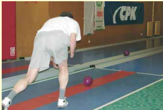
Napad na keglje.