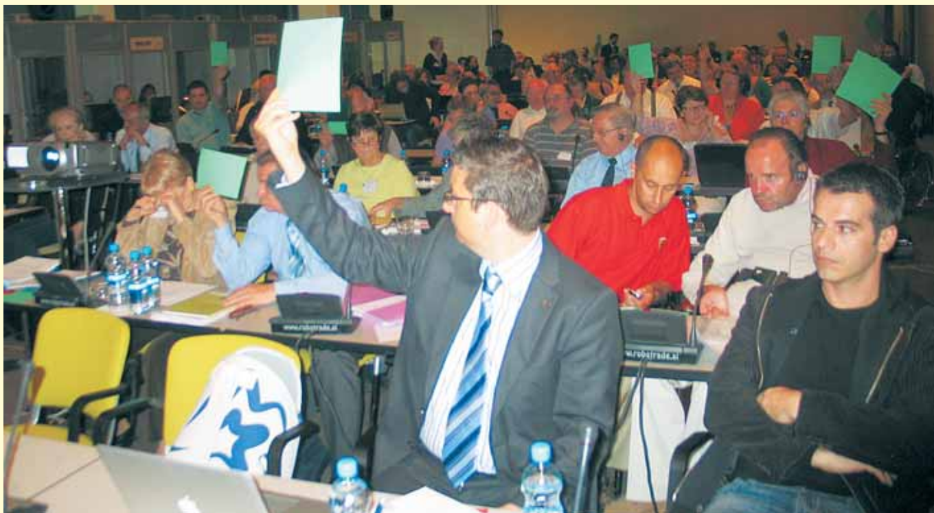
Udeleženci med delom na kongresu Evropskega invalidskega foruma v Ljubljani.